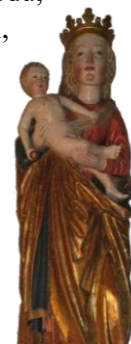
Panna Mária Lutilská

Panna Mária Lutilská ochránila si Lutilu v minulosti, oroduj za nás aj v tejto ťažkej dobe!