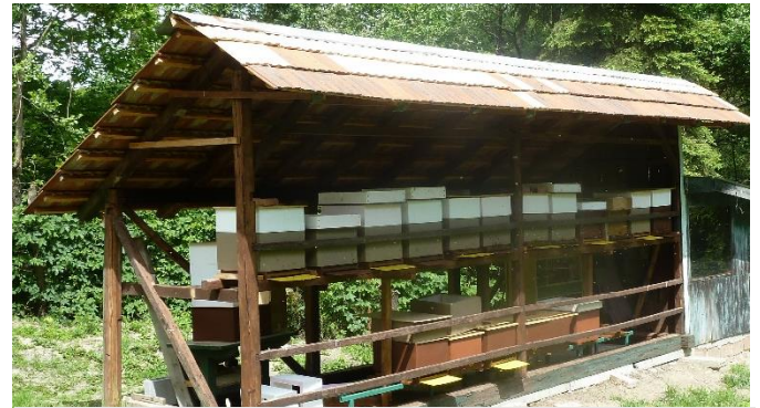
Obrázok: Opravený včelín v Jelšínach